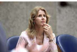
Staatsecretaris M. Keijzer